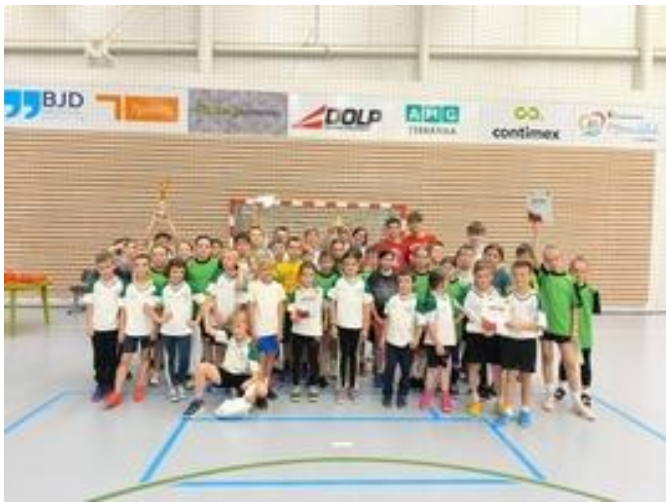
Obrázek 11 Turnaj v házené