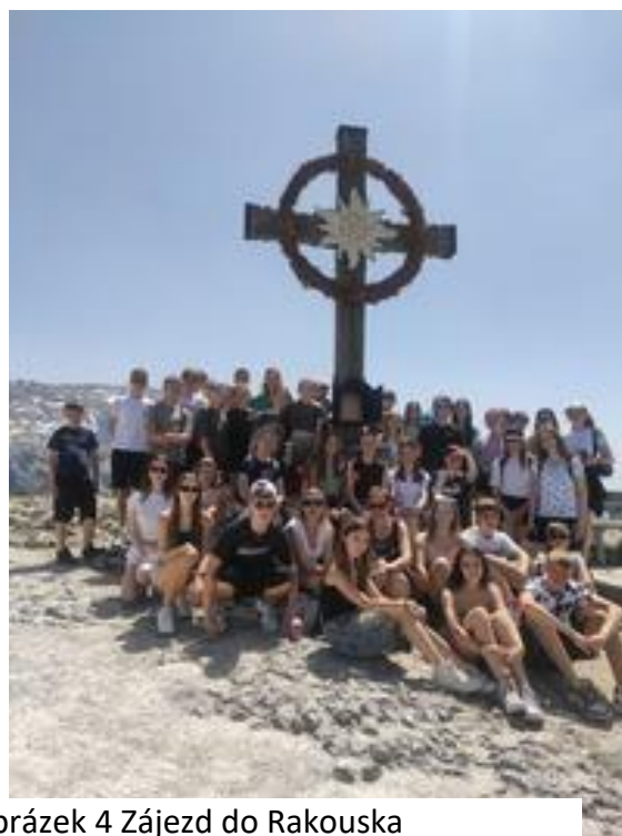
Obrázek 4 Zájezd do Rakouska