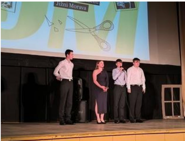
Obrázek 9 Příběhy našich sousedů - prezentace