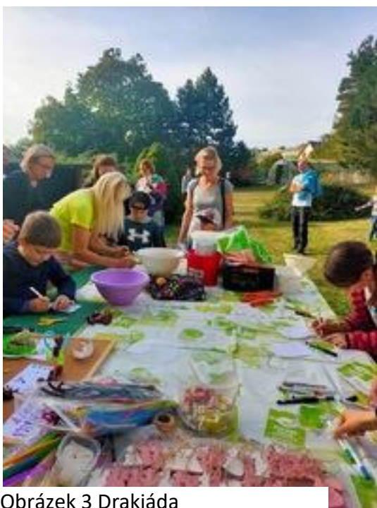
Obrázek 3 Drakiáda