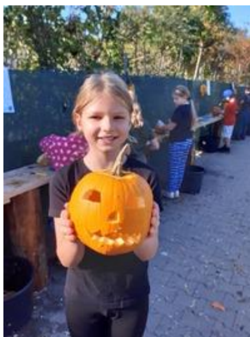
Obrázek 6 Tradiční dýňování