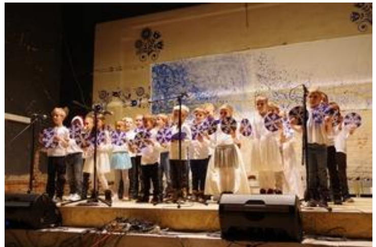
Obrázek 8 Vánoční besídka