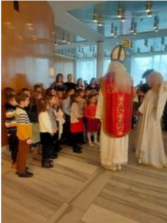
Obrázek 7 Návštěva divadla 5. 12.