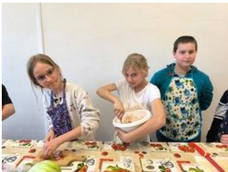
Obrázek 5 V. třída v kuchyňce