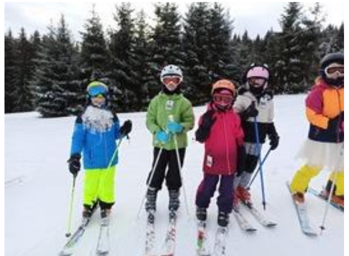
Obrázek 10 Škola v přírodě na horách