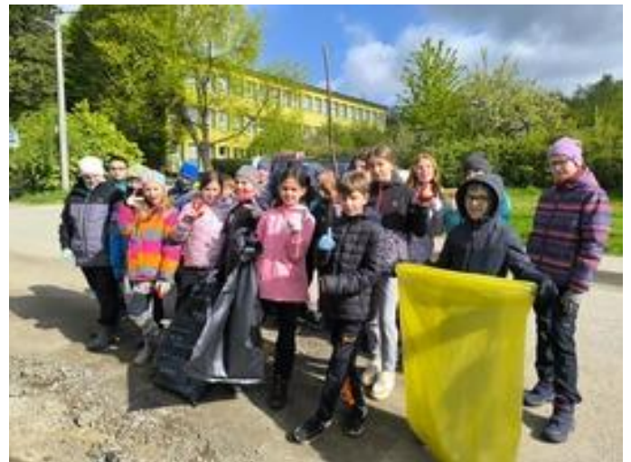
Obrázek 12 Den Země