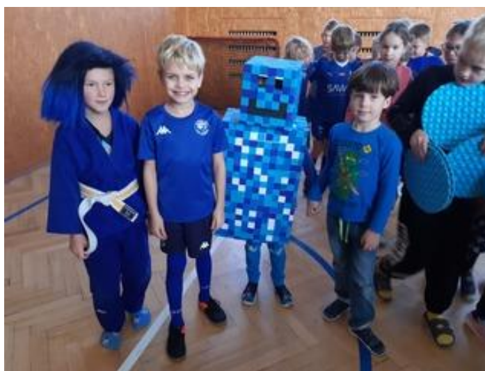
Obrázek 1 Modrý pátek