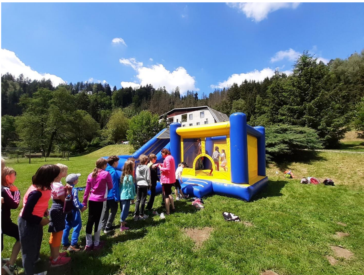
Škola přírody v Hamrech