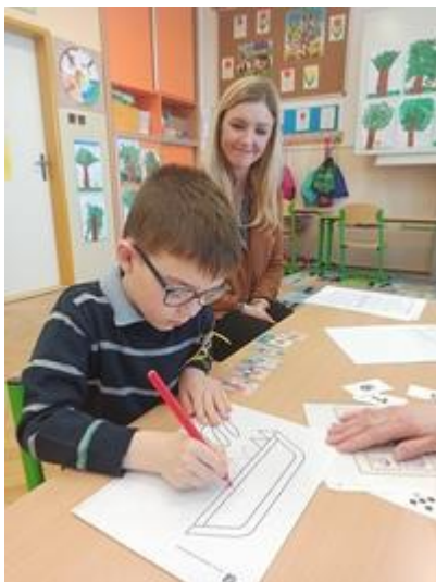
Zápis do první třídy