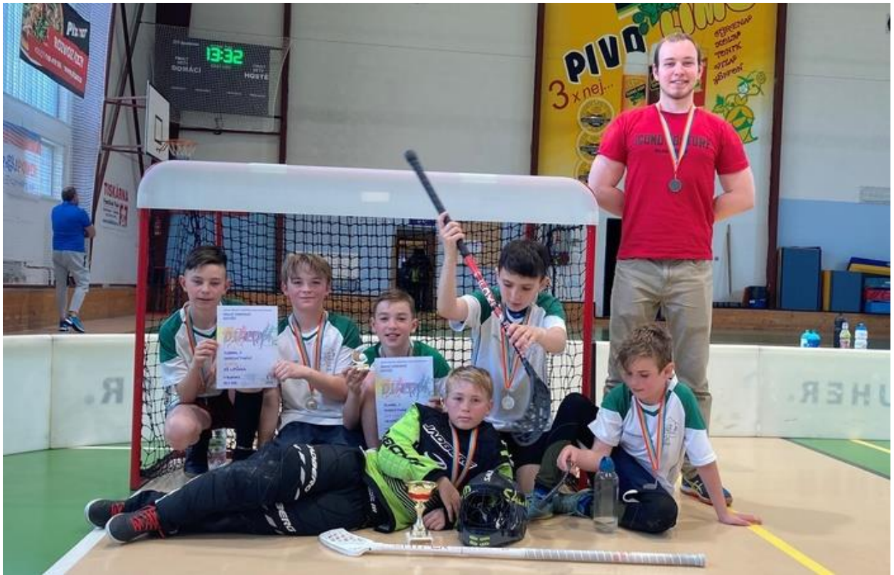
Okresní kolo ve florbalu – 2. místo