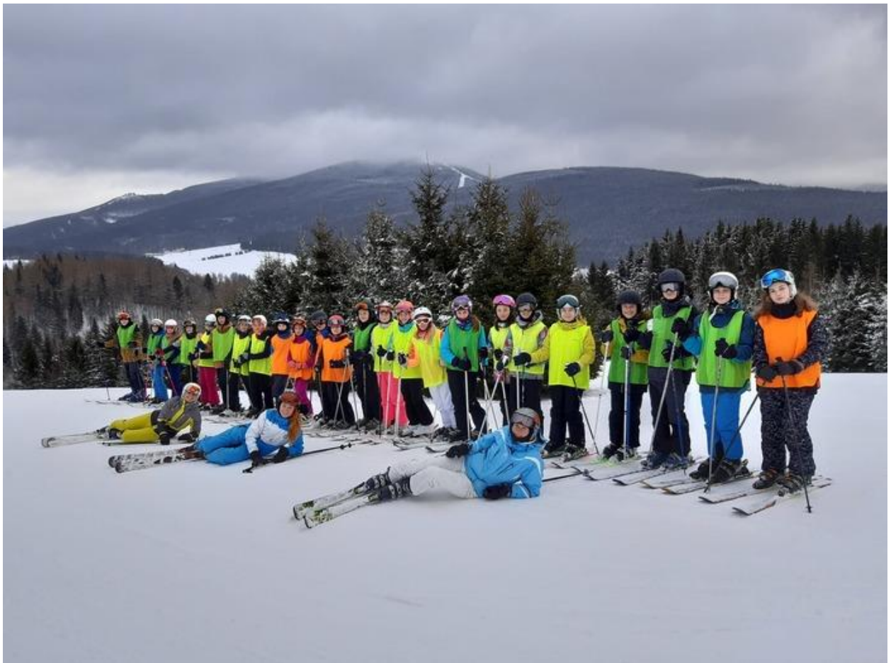
Lyžařský kurz VII. třída