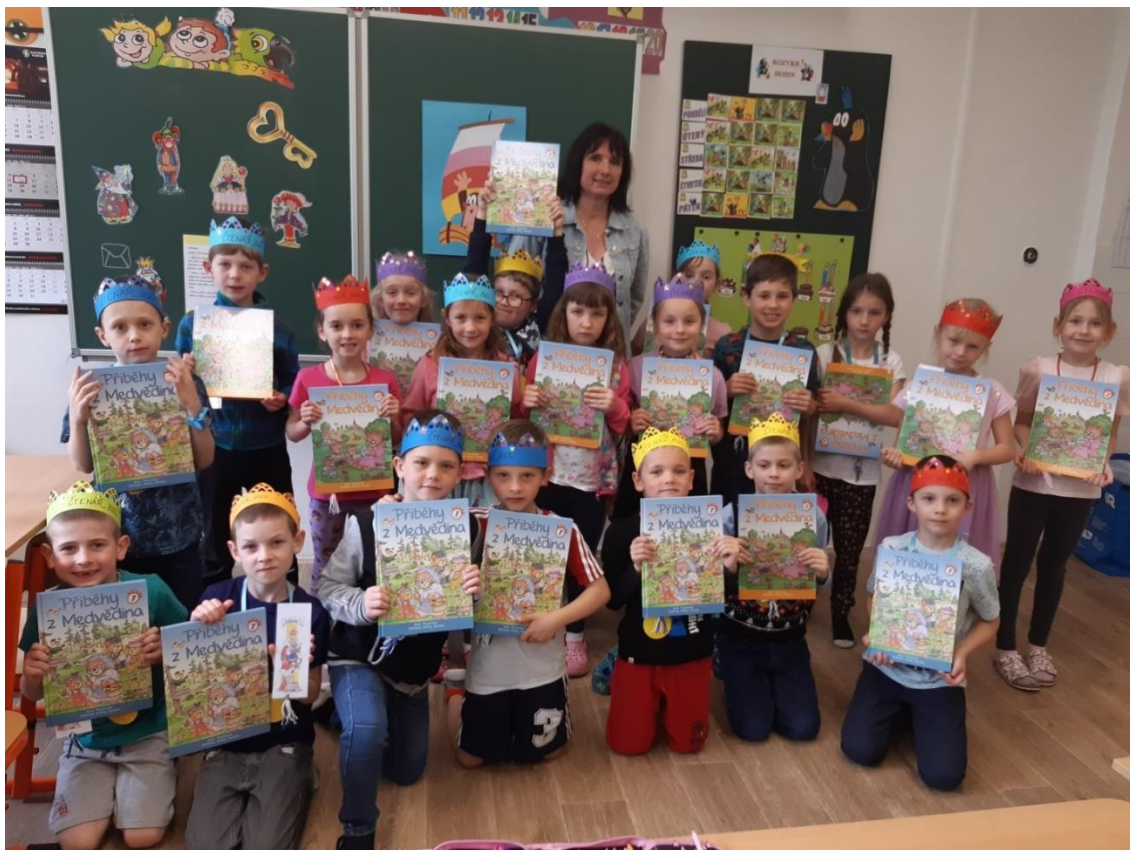
Pasování na čtenáře v I. A